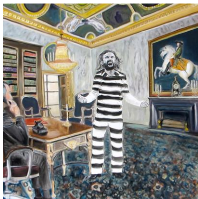
Cyril Kuhn, Avanti Prigione , 2014 Öl auf Leinwand, 168×168 cm

In Kooperation mit dem Neuen Museum Biel NMB zeigt das Kunsthaus Grenchen in einer institutionsübergreifenden Ausstellung Werke aller drei Generationen dieser aussergewöhnlichen Künstlerfamilie. Das Kunsthaus konzentriert sich dabei schwergewichtig auf das künstlerische Schaffen von Rosina Kuhn in Kombination mit Werken von Cyril Kuhn und Adolf Funk. Das NMB wird die Arbeiten von Lissy Funk ins Zentrum seiner Ausstellung rücken und gleichzeitig auch Werke von Rosina Kuhn und Adolf Funk präsentieren.