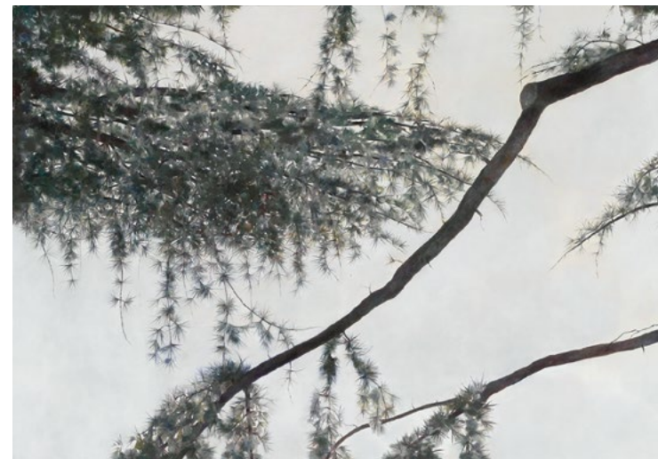
Angela Lyn, «cedaring IV», 2014, Öl auf Leinwand, 125 x 180 cm

Die Gruppenausstellung versammelt Werke von Kunstschaffenden aus der Schweiz, welche sich dem Thema des Waldes auf künstlerische Art und Weise nähern. Der Wald als Ort des Unheimlichen, der ungestörten Natur und Idylle wird genauso thematisiert wie auch der Wald als Lebensraum und Wirtschaftsfaktor.