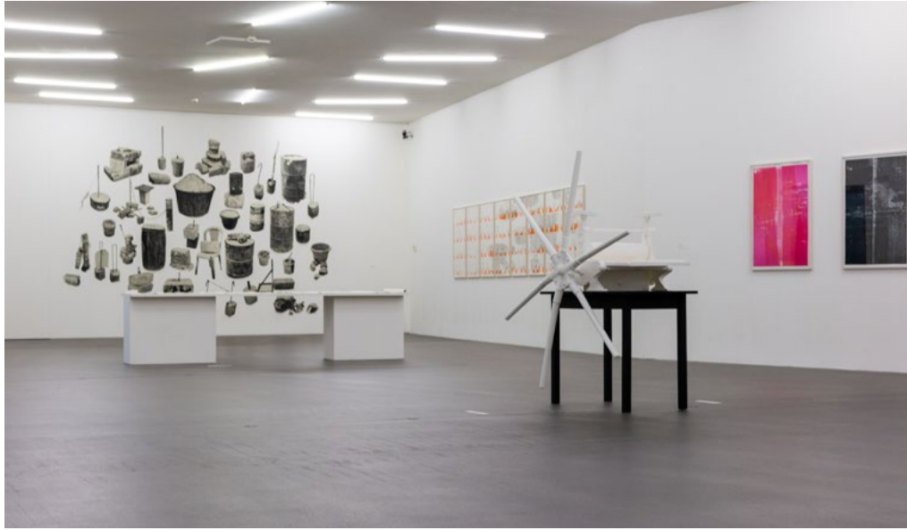
Ausstellungsansicht IMPRESSION 2019