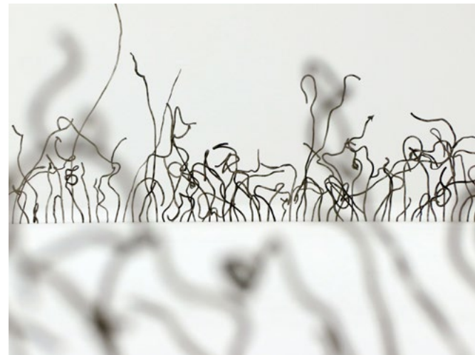
Franziska Baumgartner, «Zirkeln», 2019, eingefärbte Glasnudeln aus Wand, 200x200cm, Ausstellungsansicht: Cantonale Berne Jura, Musée jurassien des Arts, Moutier

Das Kunsthaus Grenchen stellt eine Fachjury von drei Mitgliedern zusammen, welche die eingegangenen Dossiers beurteilt und eine Auswahl trifft. Das Kunsthaus Grenchen ist verantwortlich für Konzeption und Realisation der Ausstellung. Die Ausschreibung erfolgt im Frühling 2021.