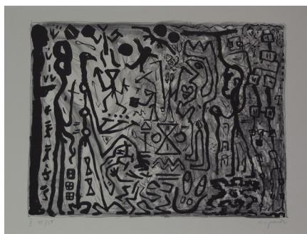
2 A.R. Penck, Uebergang , o. J. Lithographie auf Papier Masse: 60 x 80 cm