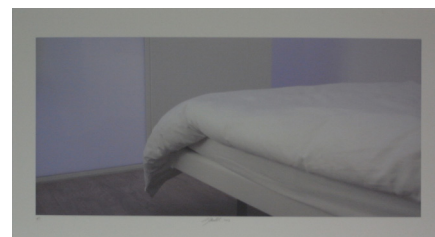
6 Thomas Woodtli, Vertrautes und Verdrängtes , 2003 Inkjetdruck auf Papier Masse: 42 x 91 cm