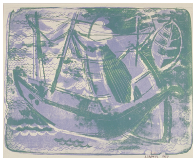
1 J. Sapkus, Boote , 1957 Lithographie auf Papier Masse: 40 x 50 cm © Kunsthaus Grenchen