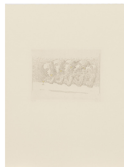
3 Markus Raetz, Bar (Mappe) , 1981 Radierung auf Bütten Masse: 65 x 50 cm