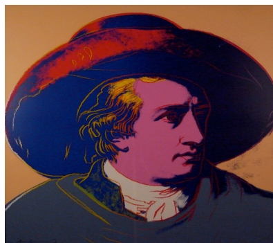
5 Andy Warhol, Goethe , 1981 Serigraphie auf Karton Masse: 96 x 96 cm Sammlung Kunsthaus Grenchen, Ankauf 1985