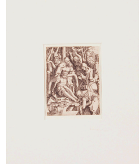
3 Albrecht Dürer, Beweinung Christi , Blatt 28 aus der Folge Kleine Holzschnitt-Passion , 1510 Holzschnitt Masse: 12 x 10 cm Sammlung Kunsthaus Grenchen, Ankauf 1972