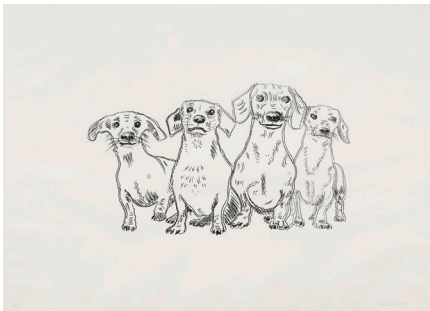
1 Rosemarie Trockel, Dackel , 1999 Siebdruck auf Shoelleshammer Masse: 72.8 x 102 cm Sammlung Kunsthaus Grenchen Schenkung Sammlung Danielle und Urs-Peter Müller, Bern, 2023