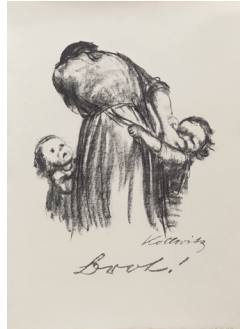
2 Käthe Kollwitz, Brot! , 924 Kreidelithographie Masse: 40 x 32 cm Sammlung Kunsthaus Grenchen Schenkung Genossenschaft Migros Aare, 2021